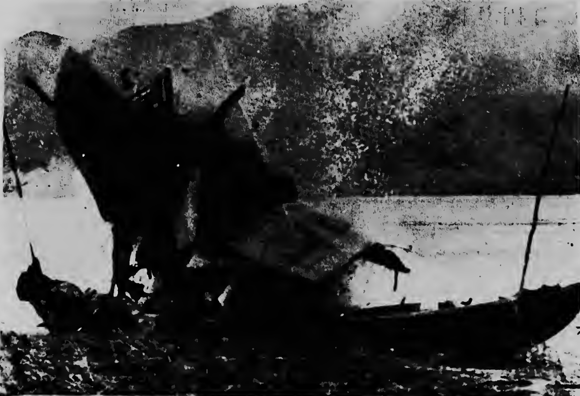
Un boto cu alimento cu tropanan aliado na Sur Vietnam a captura banda di Da Nang, ta ser dinamita aki riba. E tabata forma parti di un serie di 16 boto cu nan a hanja durante un operacion di limpieza den e area di Da Nang.